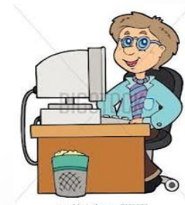
JEFE DE DEPTO