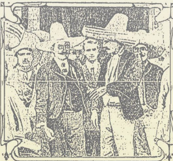
EL JEFE REVOLUCIONARIO AMBROSIO FIGUEROA APREHENDIÓ A "EL BECERRA", SEGUNDO DE ZAPATA.