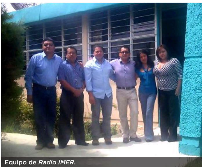
Equipo de Radio IMER .

El sistema combo permite que una estación de radio se pueda sintonizar tanto en AM como en FM. Recientemente, Radio IMER , Radio Lagarto y La Poderosa se incorporaron a este novedoso método de transmisión. Personal de cada emisora platicó a Cue sobre este logro que otorga al Instituto y sus audiencias grandes ventajas.