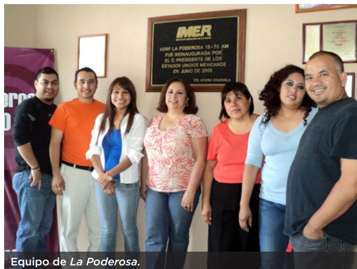
Equipo de La Poderosa .