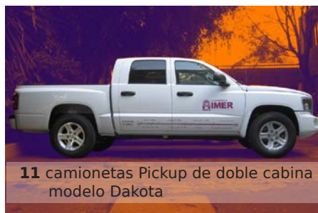
11 camionetas Pickup de doble cabina modelo Dakota