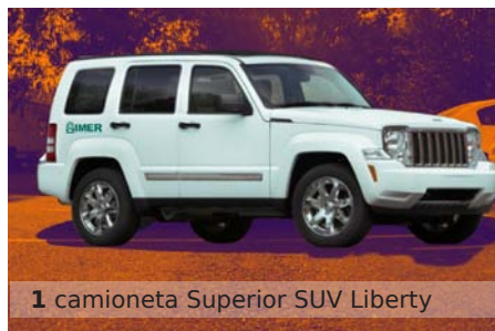
1 camioneta Superior SUV Liberty