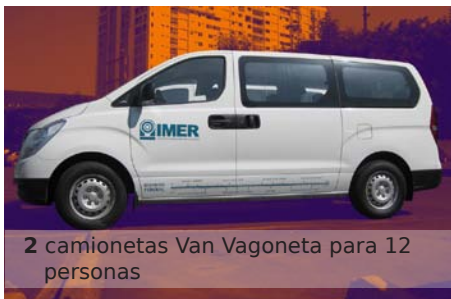
2 camionetas Van Vagoneta para 12 personas