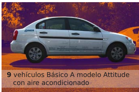
9 vehículos Básico A modelo Attitude con aire acondicionado

Los modelos vehiculares adquiridos fueron: