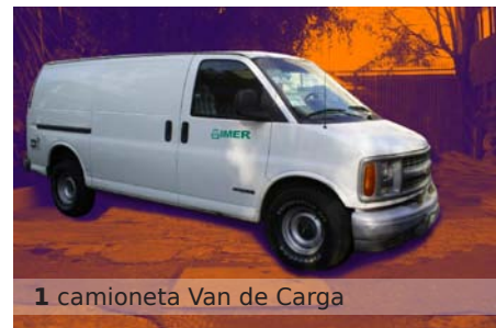
1 camioneta Van de Carga

Los vehículos estarán asignados a la Dirección General, el Órgano Interno de Control, la Dirección de Radiodifusoras –específicamente a las emisoras en los estados de la república y a promoción--, la Dirección de Ingeniería y el Departamento de Servicios Generales.